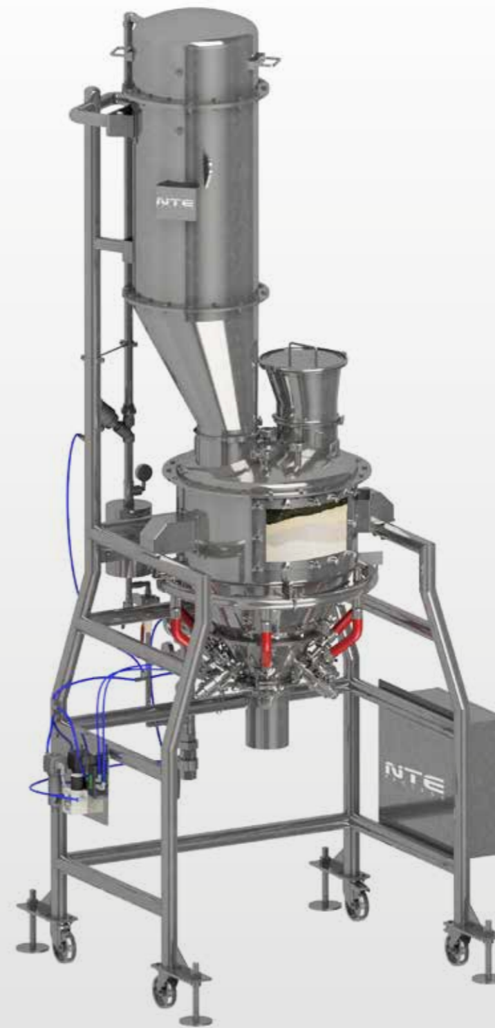
Unità da Laboratorio Mobile Lab Ubit