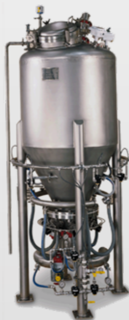
Blender Transporter M214

For food applications, it is available in a sanitary design compliant to the most stringent USDA 3° regulation. Spices, fats or other liquid additives can be introduced to the batch.