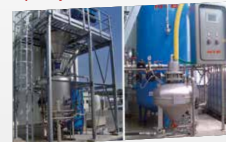
Sistema Tipico / Typical System