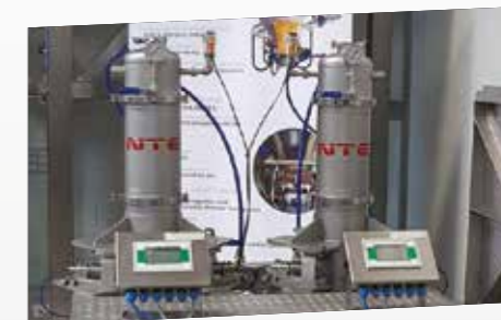
Skid Iniezione Liquidi / Liquid Injection Skid

In the latter case, the patented NTE Process aerator M532 allows the liquid to be injected into the mixing gas in a controlled manner. The injection speed and the distribution of the liquid can be controlled through different parameters. The liquid injection skid allows you to manage up to six different liquids to be injected one for each aerating valve.