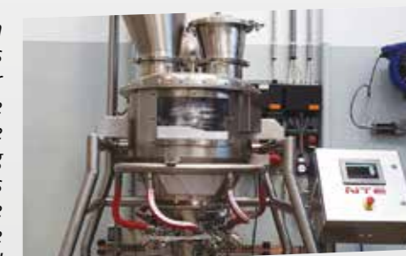
Lab Unit M537

The NTE Process Fluidizing Bin Bottom System is the right answer for problems caused by sticky powders and granular materials. This system promotes the free flowing of these materials in storage vessels, and significantly reduces bridging problems utilizing the NTE Process Aerators M532, which inject high pressure air to dislodge materials. These units are used in a wide variety of industries and applications.