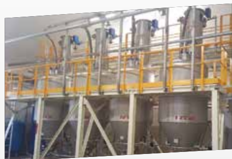
Sistema Tipico / Typical System